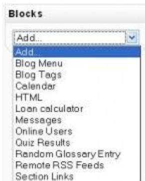
Menù a discesa Aggiungi blocco

Ogni pagina iniziale del corso contiene generalmente dei blocchi sulla sinistra e sulla destra della colonna centrale contenente il materiale del corso. I blocchi possono essere aggiunti, nascosti, cancellati, e spostati su, giù e a destra/sinistra quando la modalità di scrittura è attivata. I forum possono contribuire in modo significativo ad un efficace scambio di informazioni. E alla formazione di una comunità in un ambiente condiviso